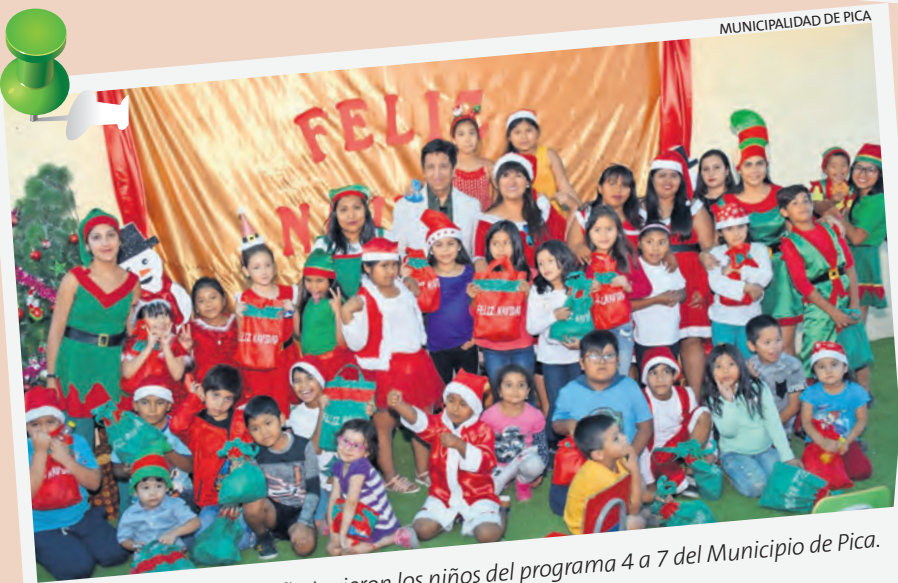
MUNICIPALIDAD DE PICA

La comunidad de Pintados también tiene su árbol navideño. La inauguración contó con la presencia del coro y de autoridades municipales.