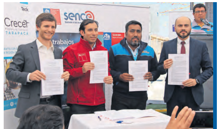
En agosto pasado, Teck y Sence firmaron un convenio para potenciar esta iniciativa por medio del uso de la franquicia tributaria para capacitación.