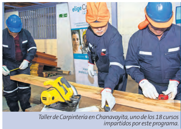
Taller de Carpintería en Chanavayita, uno de los 18 cursos impartidos por este programa.