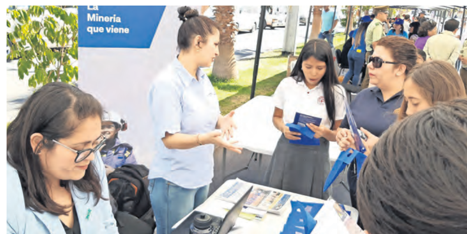
El equipo de Atracción de Talentos de Teck Quebrada Blanca dio a conocer su portal de postulaciones a la comunidad.

En el evento participó Teck Quebrada Blanca, junto a otras empresas privadas e instituciones del sector público como Sence, Conaf, la unidad de Tenencia Responsable de Mascotas y el programa Elige Crecer, que entregaron información relevante a las personas que llegaron a visitar la muestra.