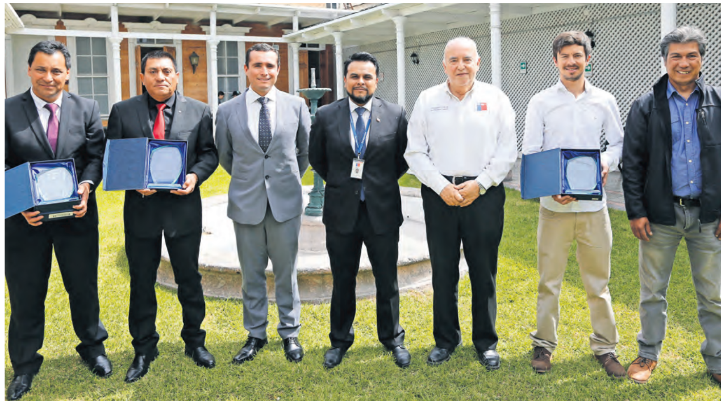
Representantes de Teck Quebrada Blanca recibieron parte de los reconocimientos durante la premiación del Coresemin de parte de las autoridades regionales de Minería y Sernageomin.

En la categoría “Comités Paritarios Destacados”, el 1° lugar lo obtuvo el Comité Paritario Planta de Teck QB. Además, en la categoría “Empresa: Mejor desempeño en Disminución en Tasa de Frecuen-