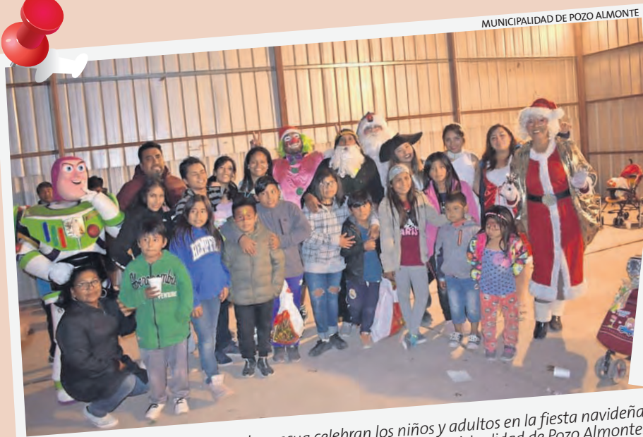
MUNICIPALIDAD DE POZO ALMONTE

Con chocolate caliente y pan de pascua celebran los niños y adultos en la fiesta navideña de la Municipalidad de Pozo Almonte.