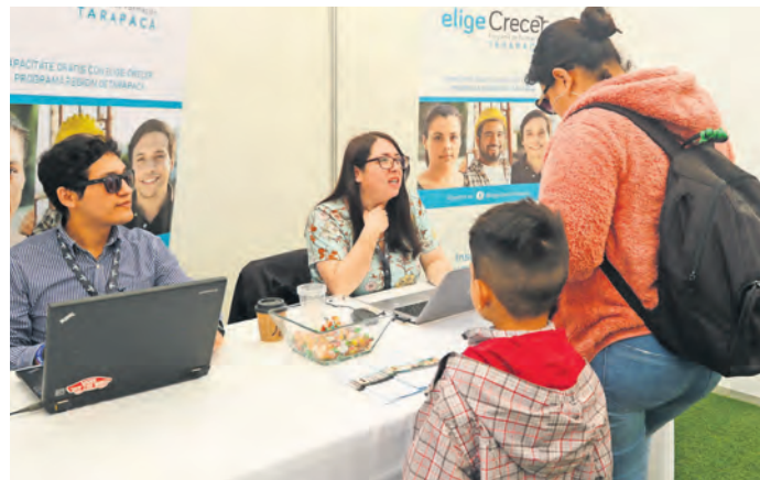
El programa Elige Crecer ha llevado su oferta de capacitación a distintas ferias laborales.

"Lo más destacado del modelo de este programa es el trabajo en conjunto que reúne el esfuerzo de distintos sectores. Por una parte, las oficinas de empleo de las municipalidades, los organismos técnicos de capacitación, y otro rol relevante ha sido el de las empresas, tanto nuestras operaciones Quebrada Blanca y Carmen de Andacollo, como otras colaboradoras como Consorcio Promet-Tecno Fast, SK Comsa y Todo Acero, que han aportado a la