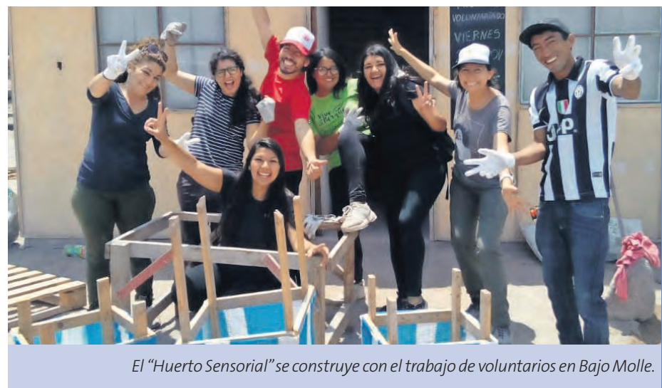
El “Huerto Sensorial” se construye con el trabajo de voluntarios en Bajo Molle.

Este es un espacio que estará abierto a la comunidad y fue un proyecto ga-