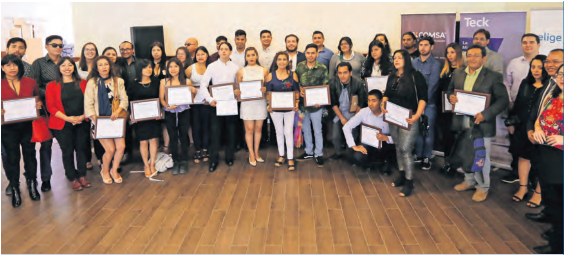
Fueron 45 egresados y egresadas de los cursos "Técnicas aplicadas de enferradura" y "Técnicas en montaje para estructuras metálicas", dictado por SK Capacitación.