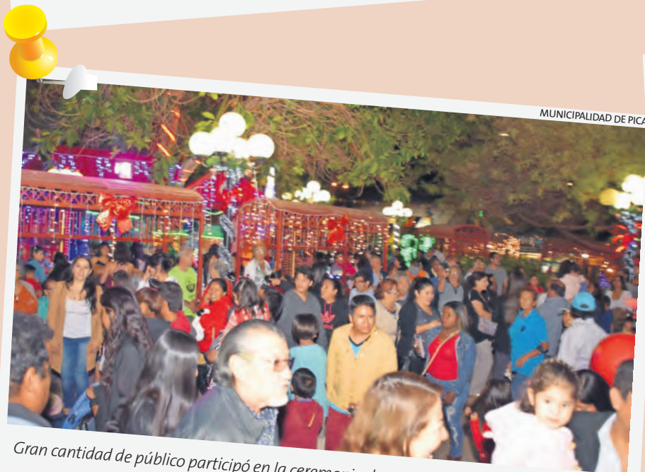
MUNICIPALIDAD DE PICA

En Matilla, la plaza fue ornamentada e iluminada con motivos navideños.