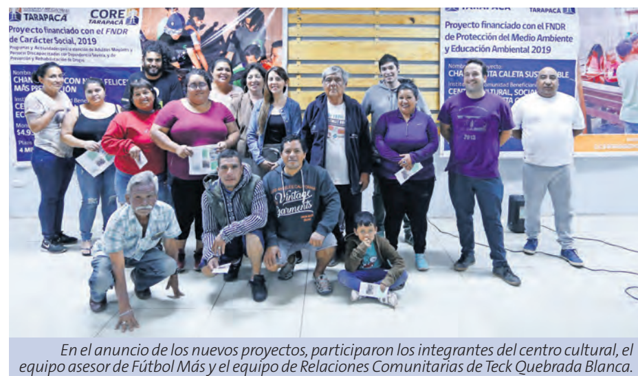
En el anuncio de los nuevos proyectos, participaron los integrantes del centro cultural, el equipo asesor de Fútbol Más y el equipo de Relaciones Comunitarias de Teck Quebrada Blanca.

El coordinador territorial agregó que esta dinámica busca generar prevención para menores y sinergias entre los adultos, para la protección de la infancia.