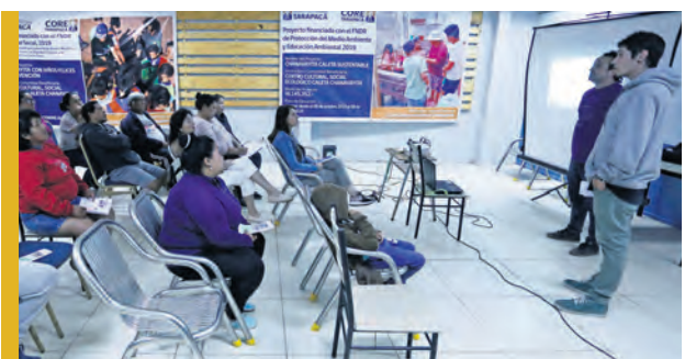
NOTICIAS: Organización social de Chanavayita presenta proyectos para la comunidad