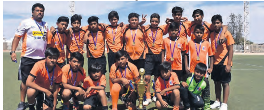
El equipo se coronó campeón de la categoría 2005-2006.

Los niños de la localidad de Colonia de Pintados de la categoría 2005–2006, obtuvieron el primer lugar en el Campeonato de Fútbol de La Liga Infantil Municipal.