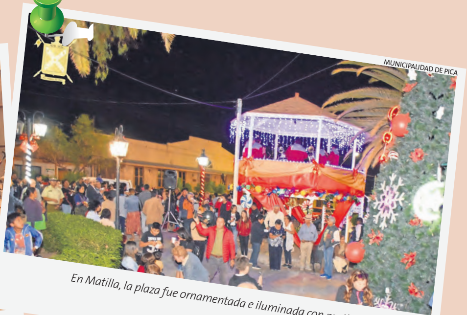
MUNICIPALIDAD DE PICA

Con chocolate caliente y pan de pascua celebran los niños y adultos en la fiesta navideña de la Municipalidad de Pozo Almonte.