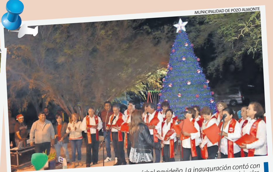
MUNICIPALIDAD DE POZO ALMONTE

Gran cantidad de público participó en la ceremonia de encendido del árbol navideño en la comuna de Pica.