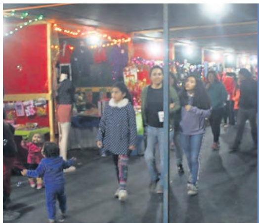
Con árbol de navidad y un despliegue de luces, junto a un tren infantil, los vecinos de Pozo Almonte inician las celebraciones.

Este año la comuna cuenta con 700 juegos, luces y adornos que rodearon el árbol, con los renos dorados, duendes, osos y trineo que están apostados en el lugar.