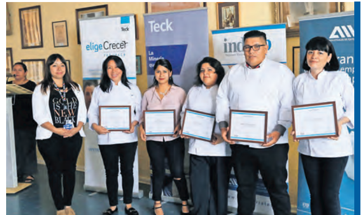
Participantes del curso "Técnicas de Ayudante de Cocina", impartido por la OTEC Indcap.

El año 2018 se realizaron siete cursos en Iquique, Chanavayita, Alto Hospicio y Pica, donde se certificaron 197 personas.