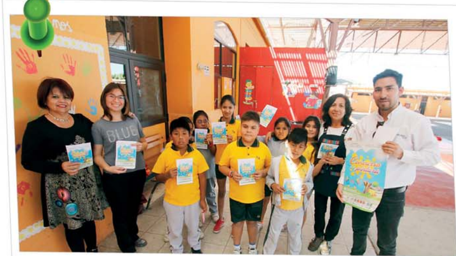
En el marco de las actividades para celebrar el mes de la Minería, el Comité Regional de Seguridad Minera -Coresemin Tarapacá-, realizó una amplia convocatoria en los establecimientos educacionales de la región, para invitarlos a participar en su Concurso de Pintura.