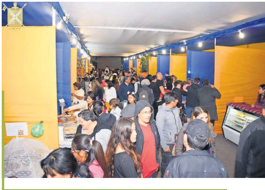
Turistas y lugareños repletaron la Feria “Pica Emprende Oasis 2018”.