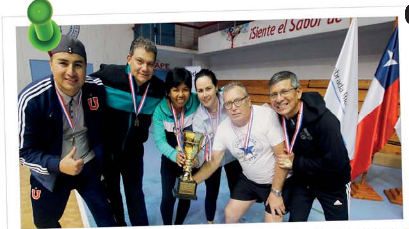
Los trabajadores pertenecientes al Club Deportivo, Social y Cultural de Teck Quebrada Blanca, realizaron un campeonato de vóleybol interempresa donde compitieron con el equipo de Teck Carmen de Andacollo. El encuentro contó con la participación de ejecutivos, supervisores y trabajadores de ambas faenas mineras.