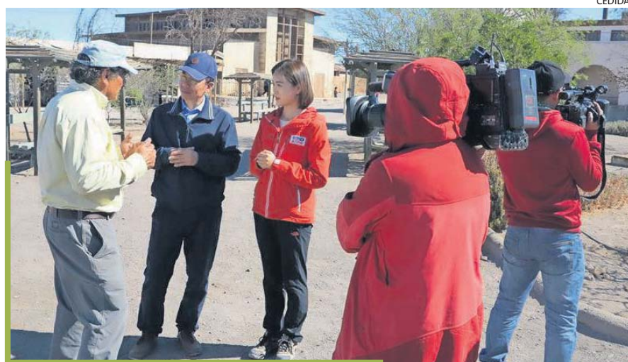
El equipo periodístico conoció anécdotas y documentos chinos.

U na visita sin precedentes es la que realizó un equipo periodístico del Canal Chino de Televisión, CCTV, el cual llegó hasta la ex salitrera Humberstone para conocer en terreno anécdotas de los migrantes de la República Popular China que vivieron en dicho lugar durante la época dorada del nitrato.