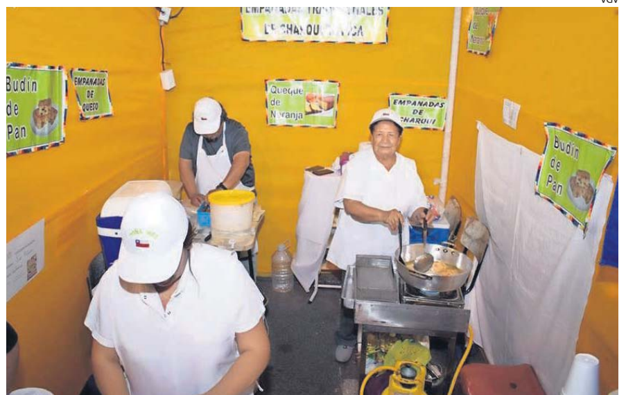
Sopaipillas, empanadas tradicionales y de charqui, y budín de pan fueron furor entre los comensales.