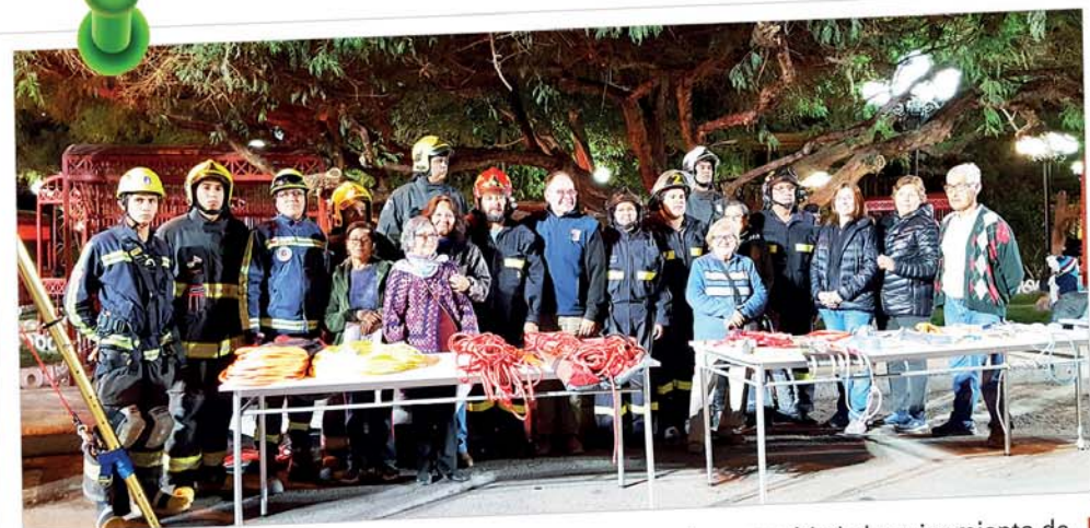
La Compañía de Bomberos de Pica dio a conocer a la comunidad el equipamiento de rescate en lugares confinados, como parte del proyecto "Una sociedad organizada y preparada para tener una comuna más segura", adjudicado en la Mesa de Trabajo Social compuesta por Teck Quebrada Blanca y las organizaciones sociales de esta comuna.