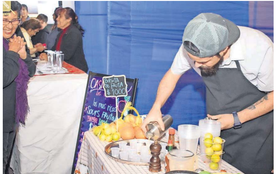
Hasta tragos hechos con fruta piqueña comercializaron en el lugar.

De esta forma, la Oficina de Fomento Productivo logró fortalecer el nexo entre los emprendedores, instituciones públicas y organismos privados pertinentes.