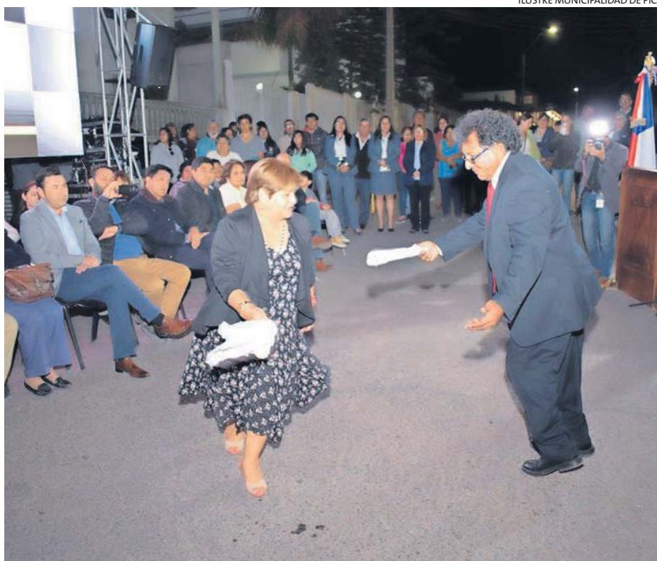
Durante la inauguración, estuvo presente el cachimbo y otros bailes típicos de la zona norte, para amenizar la jornada.