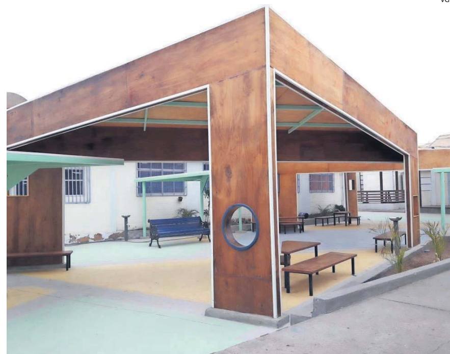
La infraestructura general de la única escuela de la caleta, ubicada a 56 kilómetros al sur de Iquique.

La inauguración de la Escuela Caleta Chanavayita ocurrió el 26 de junio de 1988. Comenzó siendo unidocente, con 14 estudiantes de primero a cuarto año básico, y su primer profesor fue Pedro Cagesane.