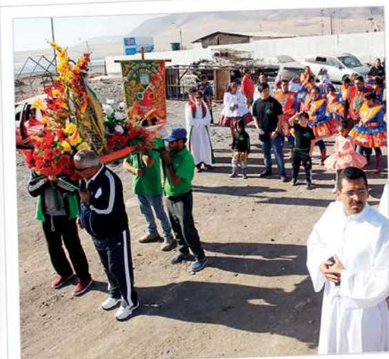
Con diversas actividades que incluyeron coloridos bailes y la música de bandas de bronce, las caletas de Chanavayita y Caramucho celebraron el Día de San Pedro, patrono de los pescadores.