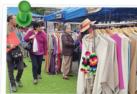
Artesanas textiles de distintas partes de la región exhibieron sus productos en una nueva versión del Mercado Campesino, organizada por Indap Tarapacá en la plaza Prat de Iquique.