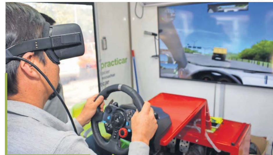
El Centro Móvil también cuenta con insumos didácticos para niños y adolescentes que ilustran de forma clara el mensaje de los peligros.

Los asistentes interactuaron con un equipo tecnológico que recreó de forma virtual diferentes escenarios de conducción. Por ejemplo, consta-